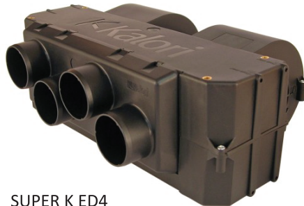
SUPER K ED4