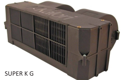
SUPER K G