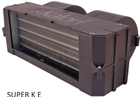
SUPER K E