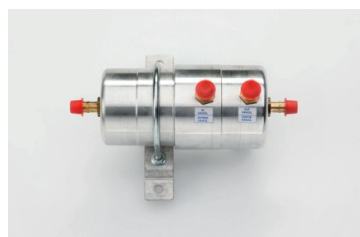
Calentador de Gas Oil y Válvula reguladora de Temperatura (OPCIONALES)